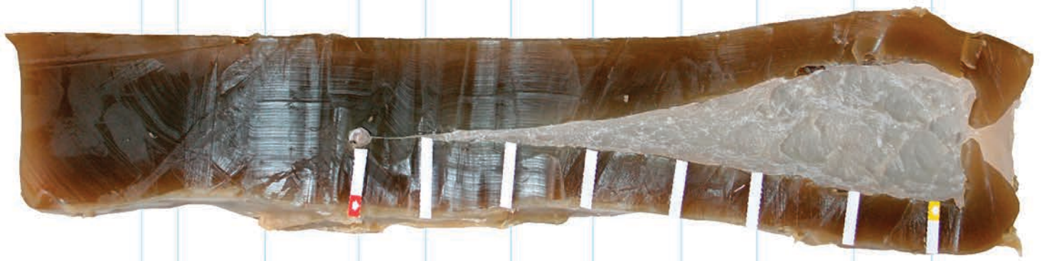
Punta Accubond de Nosler sobre calibre 7 mm Blaser Magnum.

Pero los grandes factores que hemos de tener en cuenta a la hora de elegir un calibre son, que disparar a más de 300 metros de distancia es una temeridad, salvo para gente muy experta o que tiene unas aptitudes excepcionales para el tiro. Que si no apuntamos bien ya nos pueden dar munición con trayectoria más plana, que seguiremos fallando igual. Que sólo se consigue más energía a base de incrementar el retroceso que soportamos. Y que conseguir una gran velocidad con una adecuada precisión es técnicamente muy complejo.